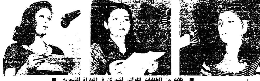
ثلاث من الطالبات اللواتي اشتركن في المباراة الشعرية